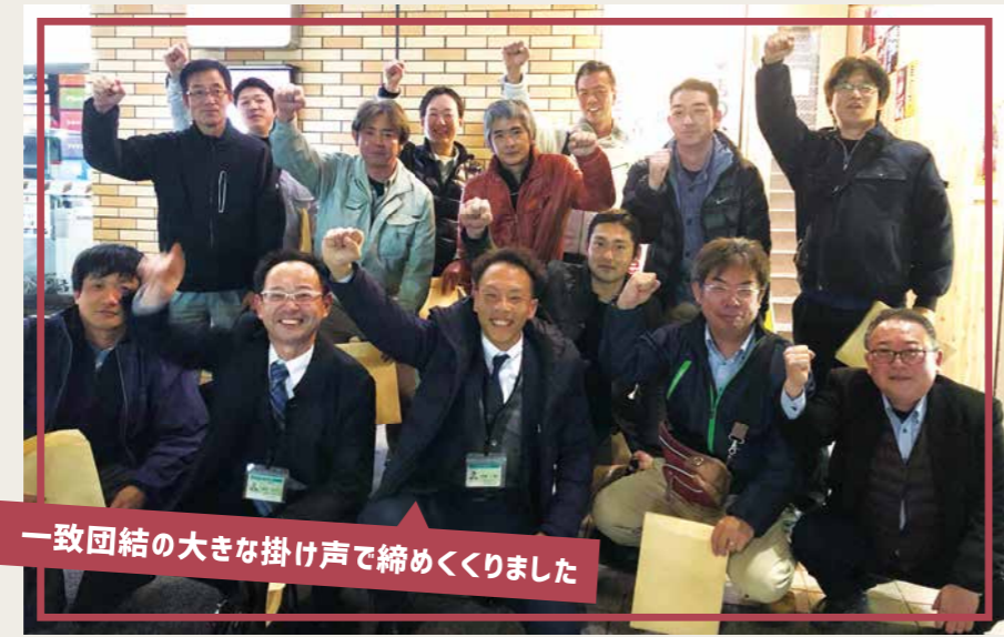
一致団結の大きな掛け声で締めくくりました

自社スタッフや清掃クルーと一緒に、ビル管理や清掃を手掛ける協力業者のメンバーは私たちにとってなくてはならない存在です。豊興業では定期的に協力業者会を開き、意見交換や情報・技術を共有することで、ムラのない安定した高品質のサービス提供へと還元しています。3月9日の協力業者会では、「事故、品質に関するクレーム情報の共有や注意点」を中心に、使用する洗剤、ワックスの検証や安全についての取り組み、意見が交わされました。