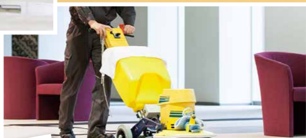
カーペットクリーニング