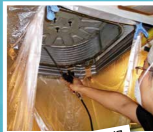
エアコン洗浄・フィルター清掃