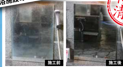
温浴施設のシリカスケール除去