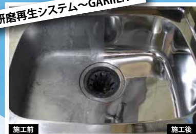
研磨再生システム〜GARILA〜

トイレ、温浴施設のガラス・鏡、賃貸物件の浴槽やステンレスシンクを独自の技術で新品同様に。