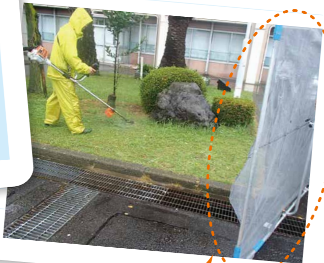
飛び石防止ネット

除草作業で使う刈払機は刃物が高速回転し、 使い慣れない人が取り扱いを誤ると大きなケガや事故 につながります。転倒や刈刃の跳ね返りで刈刃に接触したり、刃物に噛んだ小石が弾丸のように飛んで周囲の建物や車、人に重大な被害を及ぼす事故(飛び石事故)も起こり得ます。鎌や鍬での手刈りも、普段から使い慣れていなければ危険を伴う作業です。豊興業では作業員に 刈払機安全衛生教育 を行い、万全な対策のもと安全に配慮した除草作業を行っています。