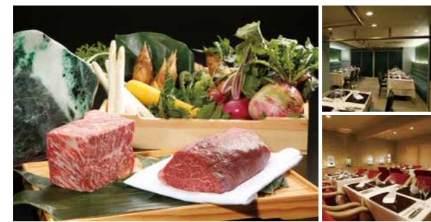
▲厳選近江牛、農家直送の新鮮な野菜をふんだんに