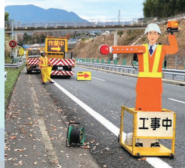
高速道路や国道での難易度の高い道路規制を得意としている

そして同じ頃に社名を変更したこともあり、会社内外へイメージチェンジしていく姿のアピールが上手くいったのだと思います。