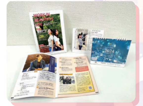
好評を博した就活パンフレット「work in beautiful life」

関係各所から非常に好評いただいた昨年のプロジェクトをさらに進化させ、今年も産学連携プロジェクトがスタートします。「学生の学生による、学生のための就活パンフレット」というテーマはそのままに、昨年と比較し、より学生が将来を考える上で多面的に情報が得られるような内容にする計画です。「三方良し」を大切にしながら、Well-Being推進のモデルとして社会へ波及していけるよう尽力してまいります。